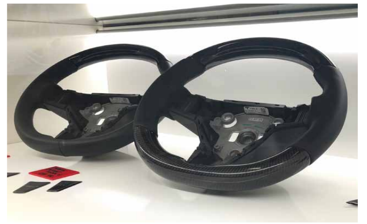
Aufwertung für den Tesla Innenraum