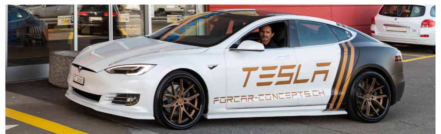
Alles rund um Ihren Tesla finden Sie bei FORCAR CONCEPTS