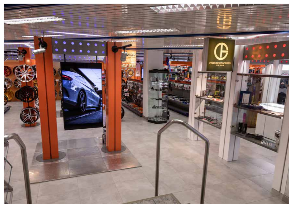
Neu: 500m 2 Ausstellungsfläche für Tuning & Zubehör