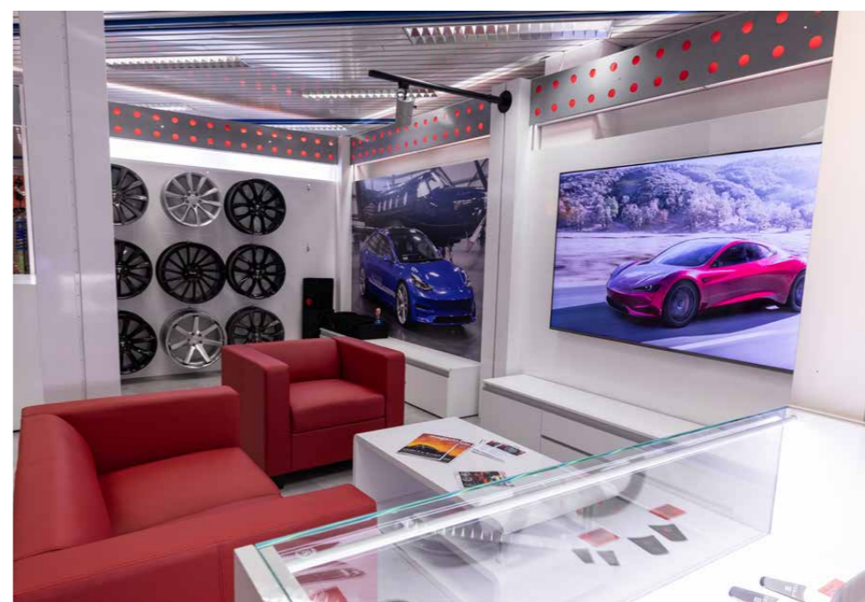
80m 2 Forcar Concepts Store for Tesla

NEU Forcar Concepts startet mit Tesla. Als offizieller Partner von T Sportline, RPM und Unplugged Performance, bietet Forcar Concepts Hilfe bei der Individualisierung von Tesla-Modellen.