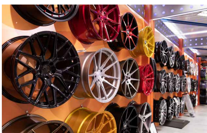
Tuning beginnt bei den Felgen