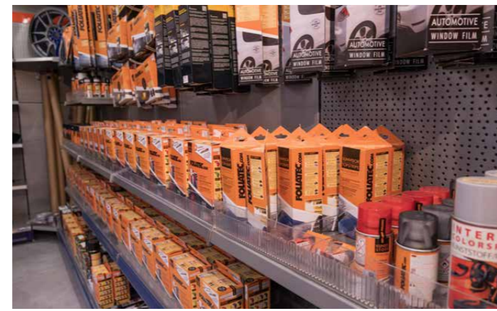
Über 30'000 Artikel ab Lager verfügbar