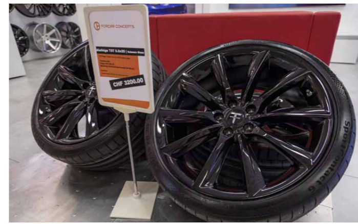
Ein Teil aus dem T Sportline Programm